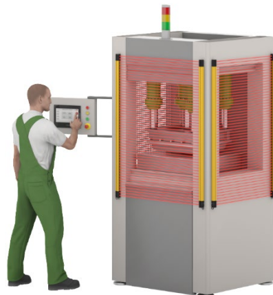
Abbildung 4: SLC-4 Eingriffsschutz