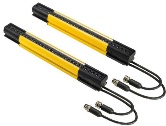
Abbildung 1: Die SLC4-Sicherheitslichtvorhänge eignen sich hervorragend für den Finger- und Handschutz direkt im Gefahrenbereich von Maschinen.