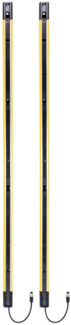
Abbildung 2: Sicherheitslichtgitter SLG-4 mit 4 Strahlen