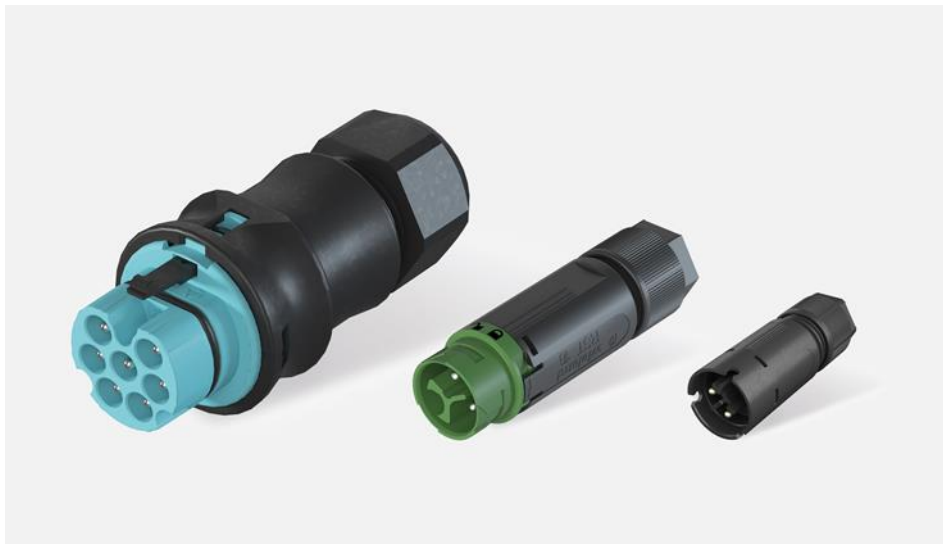
RST® Classic, RST® Mini und RST® Micro