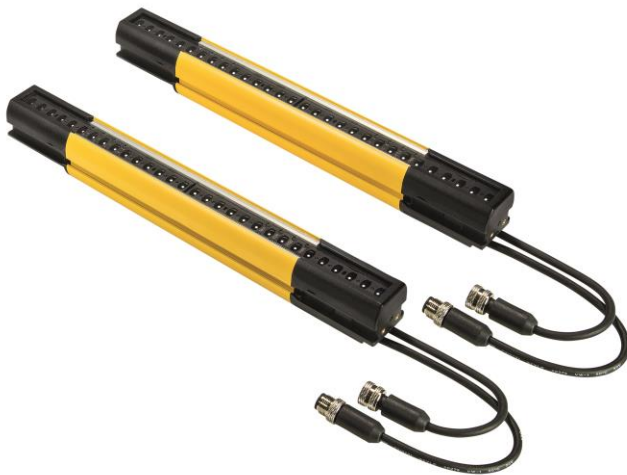
Abbildung 2: Die SLC4-Sicherheitslichtvorhänge eignen sich hervorragend für den Finger- und Handschutz direkt im Gefahrenbereich von Maschinen. (Bild: Wieland Electric)

Abbildung 1: Spart Platz im Schaltschrank und ermöglicht mit ihrer integrierten Motion-Funktionalität die Überwachung von bis zu 100 Grenzwerten: Die neue samos®PRO MOTION Sicherheitssteuerung von Wieland Electric. (Bild: Wieland Electric)